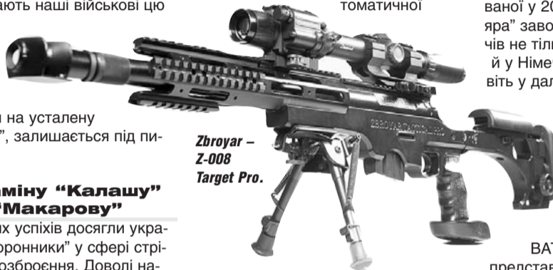
Zbroyar – Z-008 Target Pro.

Варто зазначити, що це не єдиний зразок автоматичної